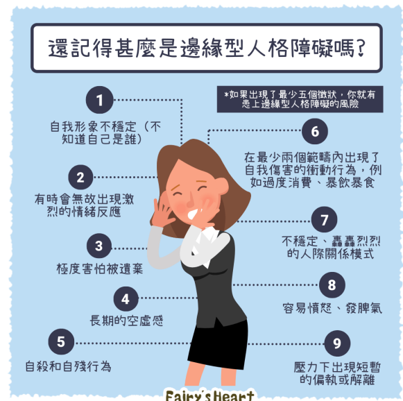
圖二、邊緣型人格障礙可能症狀

根據統計，世界上有 1 到 3% 的人口患有邊緣型人格障礙，因為很常和其他疾病合併，所以很常被大眾忽略，患者的男女比例約為 1:3，被診斷出有此類人格障礙的年齡大多介在 18 到 25 歲之間，但不可否認的是 18 歲以下的青少年也是有機會患上的，只是醫生需要更加用心的評估。