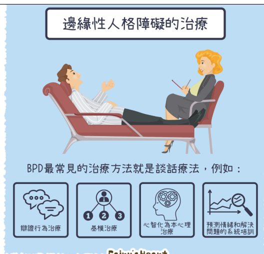
圖三、心理治療常見方式

邊緣型人格障礙患者可能擁有多項精神疾病的合併，所以千萬不要叫他們想開點或別想太多，更不要去刺激他們，面對這類人群時，我們只需做到陪伴及聆聽即可，那些專業的東西還是交給醫生吧！如果你發現自己有以上症狀也不用太緊張，尋求專業的協助一定是件好事。那麼，你現在明白「邊緣人」的真正含意了嗎？