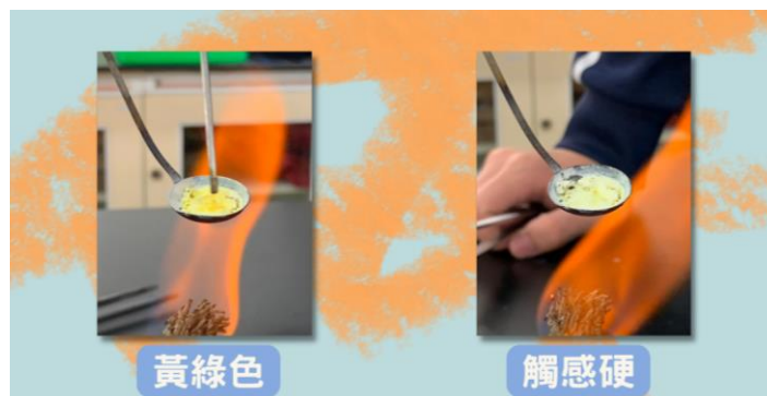
圖四：鋅的燃燒實驗結果。