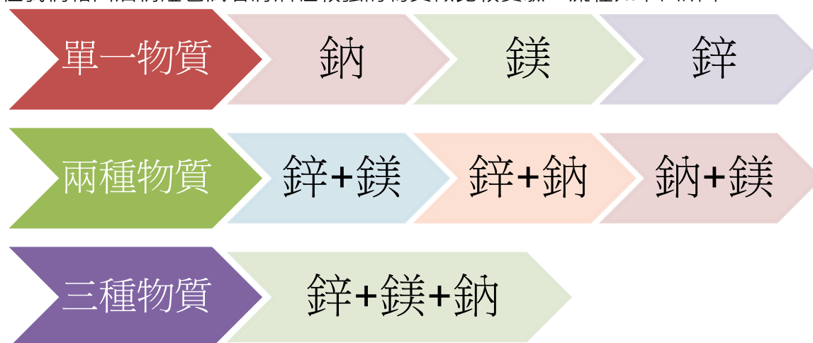
圖一：探究過程示意圖。

由於每種元素離子都有其個別的光譜，當受熱時原子的電子會躍遷至較高的不穩定能階，並以釋放一定頻率的光子的方式回到基態，從而發生焰色反應。雖然學校並沒有本生燈，但我們藉由酒精燈也試著將活性較強的物質做比較實驗，流程如下圖所示。