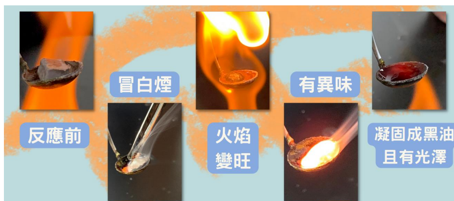
圖二：鈉的燃燒實驗結果。