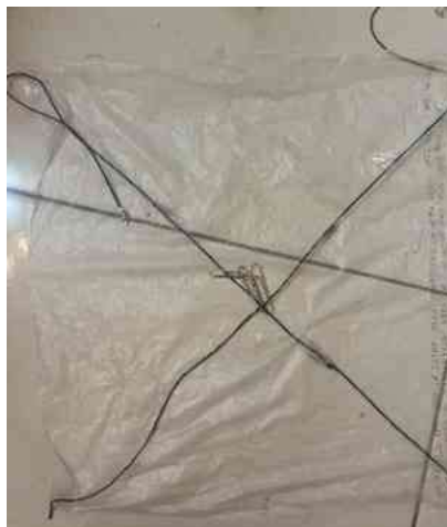
圖 5. 實驗模型