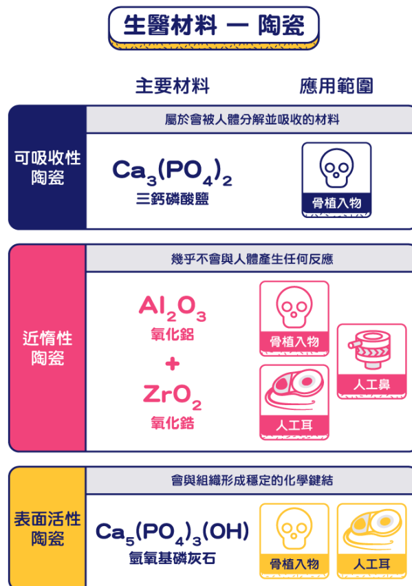
圖二、三種常用於人體的生醫陶瓷類型